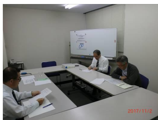
【事業性評価ワーキンググループ】