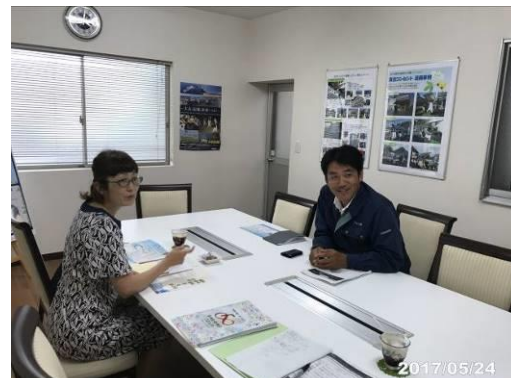
【コーディネータ活動風景】