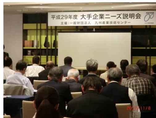
【セミナー・ニーズ発表会開催風景】