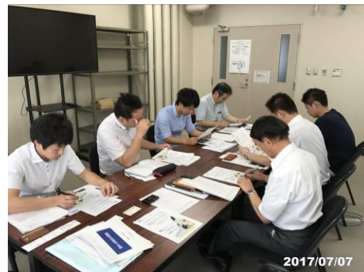
【ブラッシュアップ研究会開催風景】