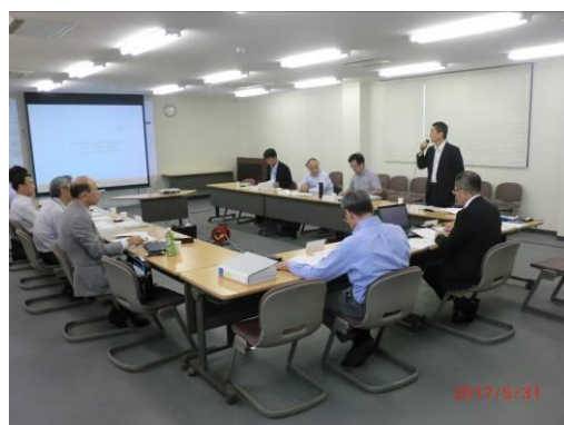
【事業化可能性検討分科会開催風景】