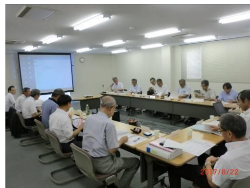
【コーディネータ連絡会開催風景】