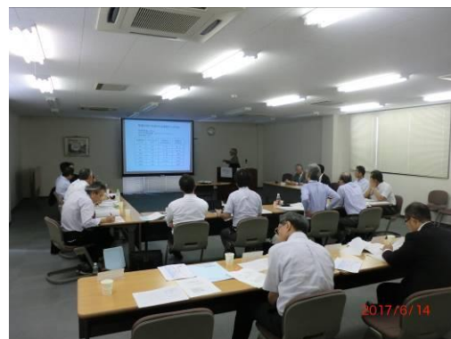
【事業推進委員会開催風景】