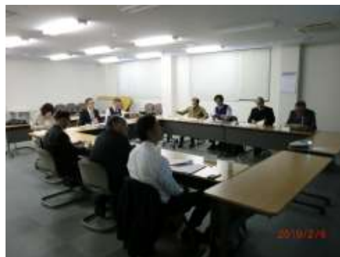
【事業化可能性検討分科会開催風景】