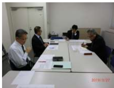
【事業性評価ワーキンググループ風景】