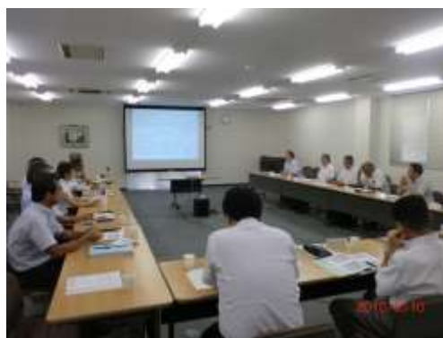
【コーディネータ連絡会開催風景】