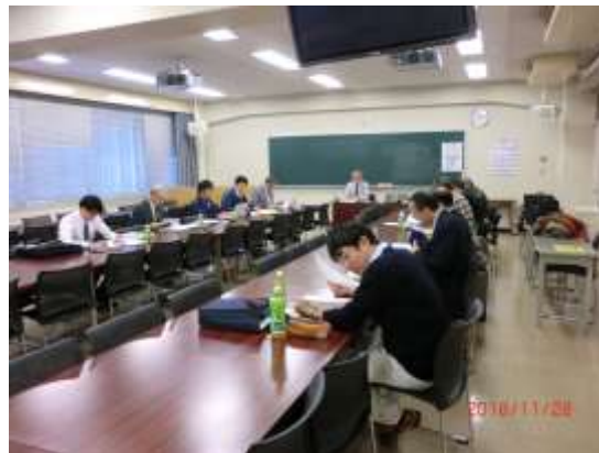
【ブラッシュアップ研究会開催風景】