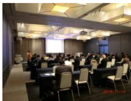
【ニーズ発表会開催風景】