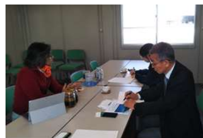
【コーディネータ活動（ニーズ・シーズ・マッチング調査）風景】