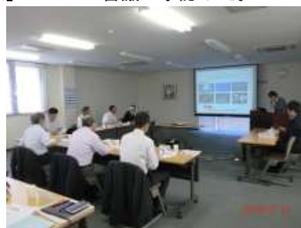
【事業推進委員会開催風景】