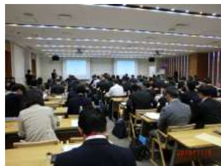
【ベトナムセミナー開催風景】