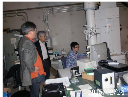
【コーディネータ活動風景】