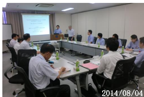
【ブラッシュアップ研究会開催風景】