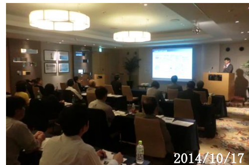
【ニーズ発表会開催風景】