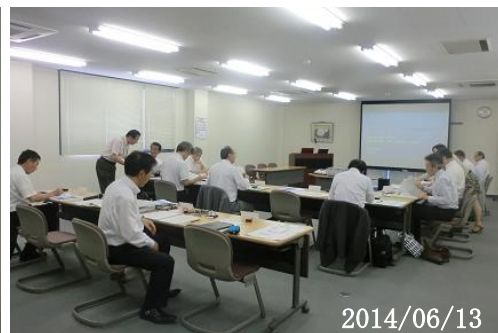
【事業推進委員会開催風景】