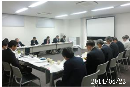
【コーディネータ連絡会開催風景】