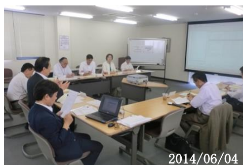
【事業化可能性検討分科会開催風景】